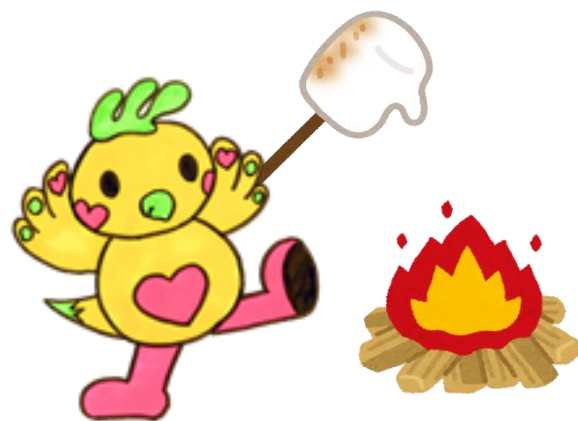
鈴が峰公民館マスコット キャラクター「すずびー」