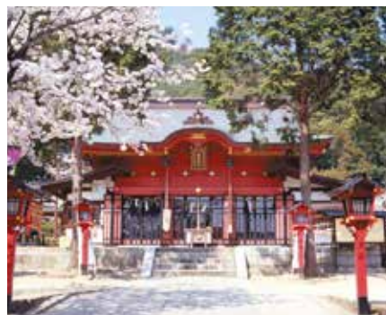
東照宮は、安産・子育て（初宮詣・七五三祭） 厄年祓と勝運・繁栄の大神