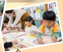
感性を磨く 絵画クラス