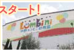
ロゴマークが 映える体育館 スタンドグラスのある 園舎の階段

山の斜面を生かした自然豊かな環境に建つ中野ルンビニ幼稚園。週2回の英語クラスでは、外国人講師と元気に楽しみながらレッスンを実施。集中して取り組む工作や絵画、音楽、体操など、さまざまな活動を通して成長をサポートします。のびのび遊ぶ子どもたちの笑顔が弾ける幼稚園です。