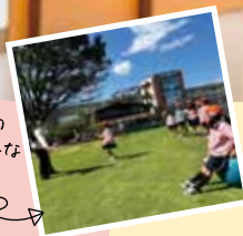
丘の上の 自然豊かな 幼稚園