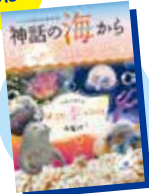
機関紙「神話の海から」