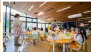
パラマランキルーム