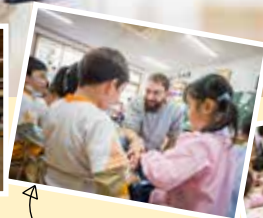
外国人講師と英語で遊ぼう