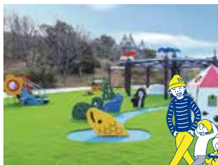
→アクアスの敷地内にあるアクアスランド「ベビーカーでも安心・バリアフリー」の広場です。

また、敷地内にあるアクアスランドには、乳幼児専用の「あそぼっこ広場」や子ども達に人気の「ふわふわトランポリンエリア」も。家族みんなで1日中楽しめるアクアスの最新情報はHPやアクアスアプリでチェック！